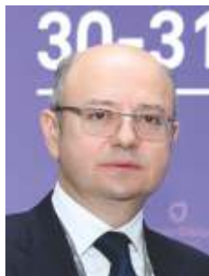
ПАРВИЗ ШАХБАЗОВ, МИНИСТР ЭНЕРГЕТИКИ АЗЕРБАЙДЖАНСКОЙ РЕСПУБЛИКИ

ВЫСТАВКА-КОНФЕРЕНЦИЯ «НЕФТЬ И ГАЗ КАСПИЯ», СОВПАВШАЯ С НАЧАЛОМ НЕФТЯНОЙ СТРАТЕГИИ ОБЩЕНАЦИОНАЛЬНОГО ЛИДЕРА ГЕЙДАРА АЛИЕВА, СЫГРАЛО ВАЖНУЮ РОЛЬ В КАЧЕСТВЕ ПЕРВОЙ МЕРЫ, ПРИВЛЕКШЕЙ ВНИМАНИЕ МИРА К РАЗВИТИЮ НЕФТЯНОЙ ПРОМЫШЛЕННОСТИ НА НОВОМ ЭТАПЕ. С САМОГО НАЧАЛА ПРИНЯТАЯ В КАЧЕСТВЕ ВАЖНОГО СОБЫТИЯ КАСПИЙСКОГО РЕГИОНА ВЫСТАВКА-КОНФЕРЕНЦИЯ СТАЛА ПРЕВРАЩАТЬСЯ В МЕЖДУНАРОДНУЮ ПЛОЩАДКУ ДЛЯ ДИВЕРСИФИКАЦИИ СОТРУДНИЧЕСТВА С УВЕЛИЧЕНИЕМ С КАЖДЫМ ГОДОМ КОЛИЧЕСТВА УЧАСТНИКОВ И ПОДПИСАНИЯ ДОКУМЕНТОВ О РАЗРАБОТКЕ УГЛЕВОДОРОДНЫХ РЕСУРСОВ. ЕСЛИ 26 ЛЕТ НАЗАД АЗЕРБАЙДЖАН ДАННОЙ ВЫСТАВКОЙ-КОНФЕРЕНЦИЕЙ ПЫТАЛСЯ ПРЕДСТАВИТЬ МИРУ СВОЙ ЭНЕРГЕТИЧЕСКИЙ ПОТЕНЦИАЛ, ТО СЕГОДНЯ ОН ПРЕДСТАВЛЯЕТ МИССИЮ НАДЕЖНОГО ПОСТАВЩИКА СТРАТЕГИЧЕСКОГО ПАРТНЕРСТВА, МЕЖДУНАРОДНОЙ ИНТЕГРАЦИИ И ЭНЕРГЕТИЧЕСКОЙ БЕЗОПАСНОСТИ. Я ВЕРЮ, ЧТО 26-Я МЕЖДУНАРОДНАЯ ВЫСТАВКА-КОНФЕРЕНЦИЯ «НЕФТЬ И ГАЗ КАСПИЯ» НЕ ТОЛЬКО ПРОДЕМОНСТРИРУЕТ ОПЫТ, НО И ОБЪЕДИНИТ УСИЛИЯ ДЛЯ ИСПОЛЬЗОВАНИЯ ЭТОГО ОПЫТА.