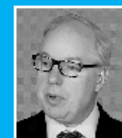
Г-Н КЕНТ Д. ЛОГСДОН, ПЕРВЫЙ ЗАМЕСТИТЕЛЬ ПОМОЩНИКА СЕКРЕТАРЯ, БЮРО ЭНЕРГЕТИЧЕСКИХ РЕСУРСОВ