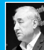
Г-Н АМИР ХОССЕЙН ЗАМАНИНИЯ, ЗАМЕСТИТЕЛЬ МИНИСТРА НЕФТИ (ИРАН)