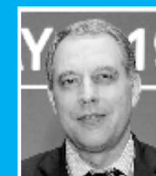
Г-Н ЮРИЙ СЕНТЮРИН, ГЕНЕРАЛЬНЫЙ СЕКРЕТАРЬ, ФОРУМ СТРАН-ЭКСПОРТЕРОВ ГАЗА (ФСЭГ)