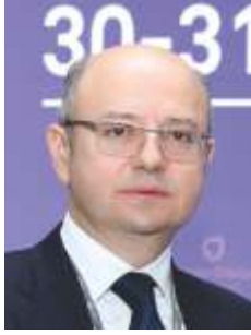
PƏRVİZ ŞAHBAZOV, AZƏRBAYCAN RESPUBLİKASININ ENERGETİKA NAZİRİ

Ümummilli lider Heydər Əliyevin neft strategiyasının başlanğıcı ilə eyni vaxta təsadüf edən "Xəzər Neft və Qaz" sərgi – konfransı və Xəzər Beynəlxalq Energetika sərgisi neft sənayemizin yeni mərhələdə inkişafına dünyanın diqqətini cəlb edən birinci tədbir kimi mühüm rol oynamışdır. İlk vaxtdan Xəzər regionunun ən mühüm hadisəsi kimi qəbul edilən sərgi və konfrans ilbəlil iştirakçıların sayının artması, karbohidrogen ehtiyatlarının işlənməsinə dair sənədlərin imzalanması ilə əməkdaşlıq əlaqələrini şaxələndirən beynəlxalq platformaya çevrilmişdir. 26 il əvvəl Azərbaycan bu sərgi-konfransla öz enerji potensialını dünyaya tanıتماğa çalışırdısa, bu gün strateji tərəfdaşlığın, beynəlxalq inteqrasiyanın və enerji təhlükəsizliyinin etibarlı təminatçısı missiyasını təqdim edir. Cəyimiz bir tədbir olacaqdır. İnanıram ki, 26-cı Beynəlxalq "Xəzər Neft və Qaz" sərgi – konfransı və Energetika sərgisi təkcə təcrübəni nümayiş etdirməyəcək, həm də bu təcrübədən istifadə üçün səyləri birləşdirəcəkdir.