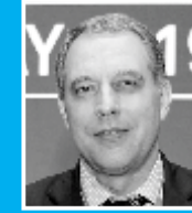
YURIY SENTYURIN, BAŞ KATİB, QAZ İXRAC EDƏN ÖLKƏLƏRİN FORUMU (GECF)