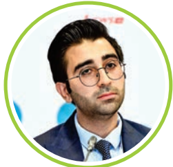
Cahid Mikayılov Azərbaycan Respublikası Energetika Nazirliyinin Mətbuat şöbəsinin müdiri